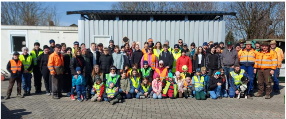
Bild: die fleißigen Helfer aus dem Wurmshamer Gemeindebereich