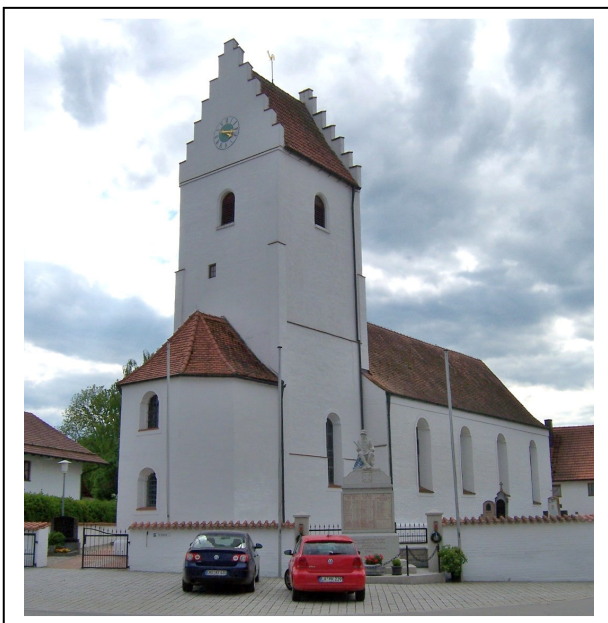
Pfarrkirche Sankt Ulrich in Untervilslern, Foto: Peter Käser, 2014.

Eine gut ausgebildete neue Generation an Geistlichen, brachte nach dem von 1545 bis 1563 dauernden Konzil von Trient im katholischen Herzogtum Bayern in vielen Pfarreien wieder eine Beruhigung und neue Kontinuität für die römisch-katholische Kirche.